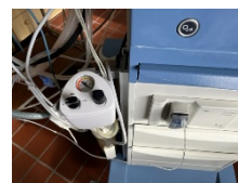
Absaugung links und Scio rechts (CO 2 )