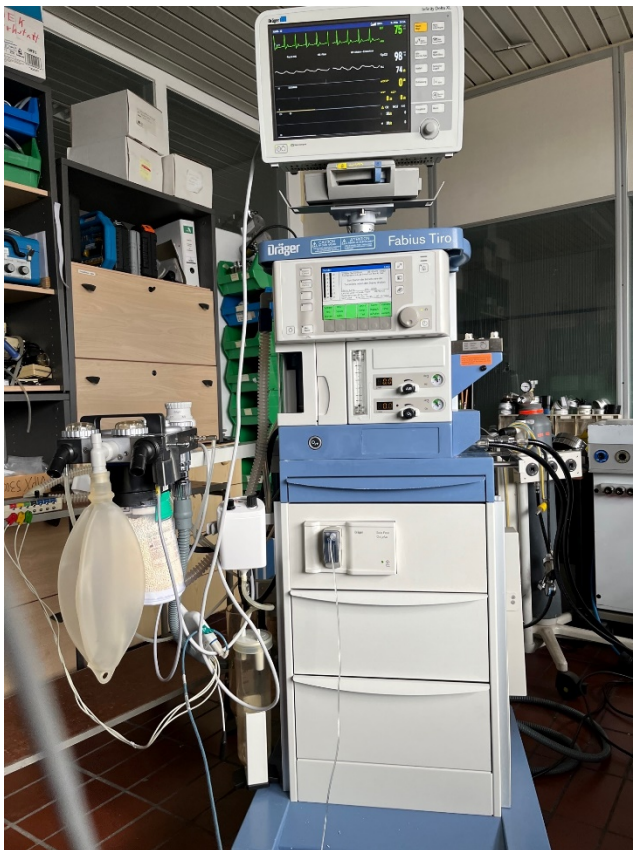
FABIUS Tiro mit Scio und Delta auf Fahrgestell (CO 2 , O 2 , A-Gase, EKG, SpO 2 und NIBP)