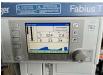
Fabius Tiro Bildschirm